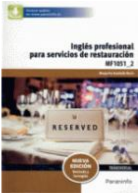
3- Inglés profesional para servicios de restauración, MF1051_2.