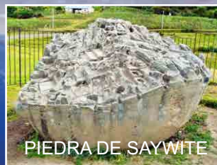
PIEDRA DE SAYWITE